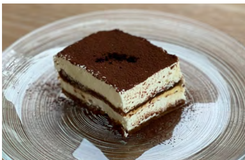
ティラミス ドリンクセット ¥ 1200 / 単品 ¥ 700