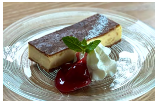
チーズケーキ ドリンクセット ¥ 1200 / 単品 ¥ 700