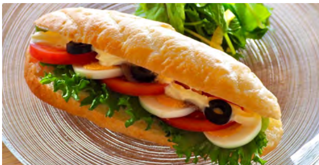
アンチョビとゆで卵 ドリンクセット ¥ 1300 / 単品 ¥ 850