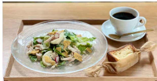
かぶとチキンのシーザーサラダ ドリンクセット ¥ 1200