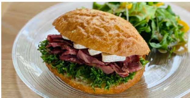
ビーフパストラミとカマンベール ドリンクセット ¥ 1300 / 単品 ¥ 850