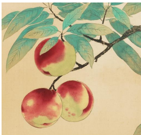
横山大観《桃》1933年（部分） 福田美術館蔵