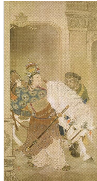
西山翠嶂《悉達發心図》 1900年 福田美術館蔵