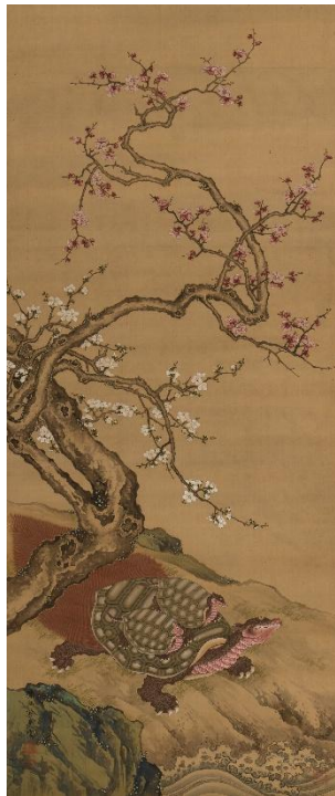
熊斐《松竹梅鶴亀図》左 18世紀 福田美術館蔵