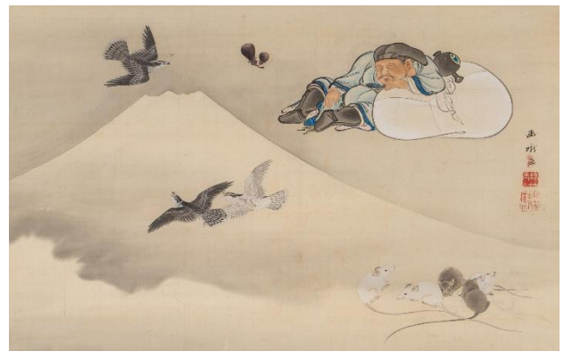
根本幽峨《大黒白鼠初夢図》1854年-1858年頃 福田美術館蔵