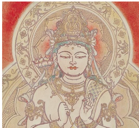
入江波光《聖観音》1946年（部分） 福田美術館蔵