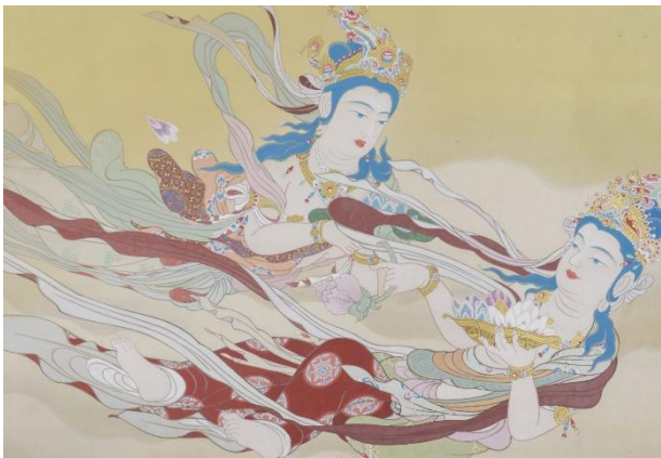
木村武山《天女散華》 20世紀（部分） 福田美術館蔵