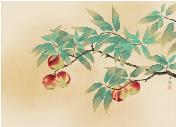
横山大観《桃》1933年 福田美術館蔵