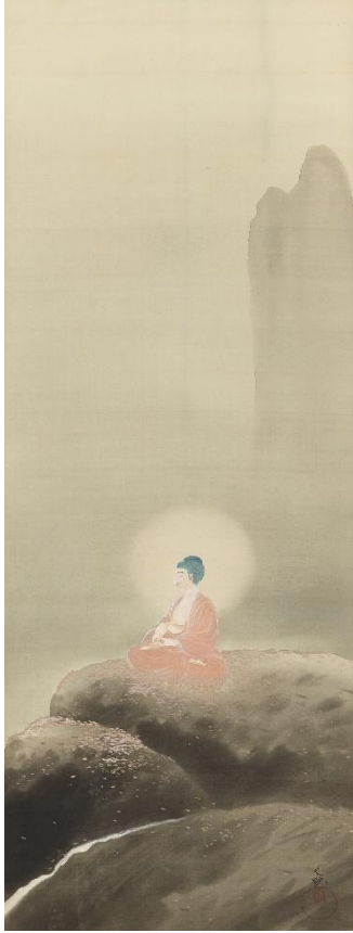
横山大観《成道大悟の釈尊》 1897-1906年頃 福田美術館蔵