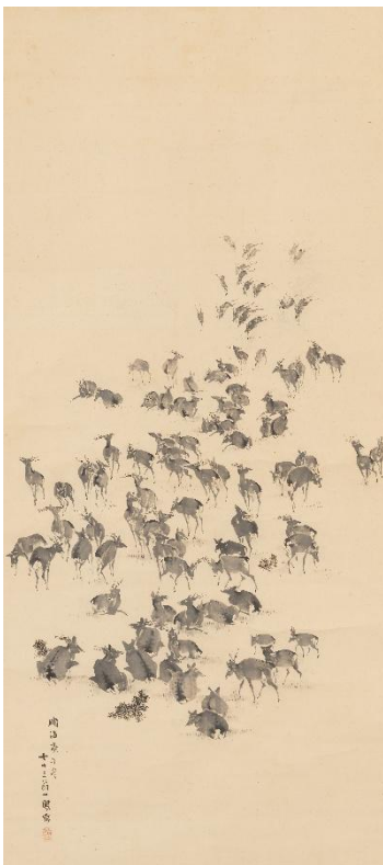
森一鳳《百蝠百鹿図》左 1870年 福田美術館蔵