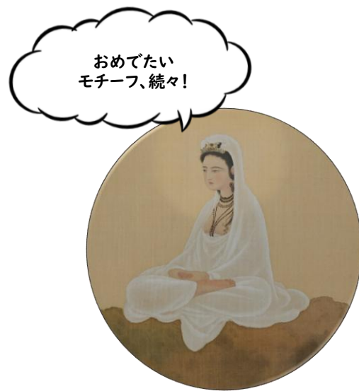
菱田春草《白衣観音》 20世紀（部分） 福田美術館蔵