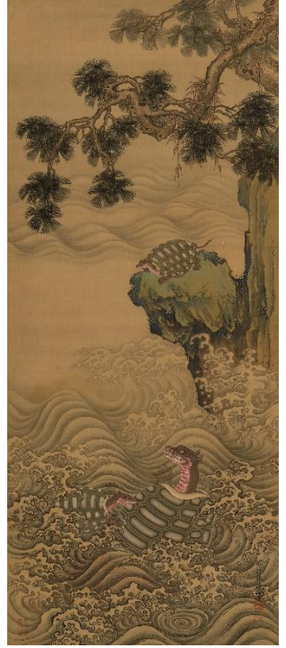
熊斐《松竹梅鶴亀図》右 18世紀 福田美術館蔵