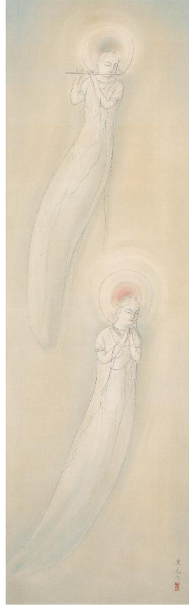
入江波光《浄天》1920年 福田美術館蔵