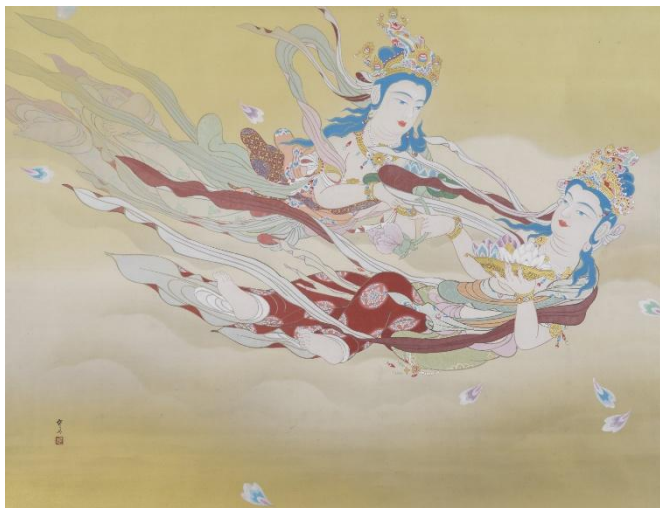
木村武山《天女散華》20世紀 福田美術館蔵