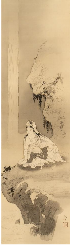
土田麦僊《観音之図》 20世紀 福田美術館蔵