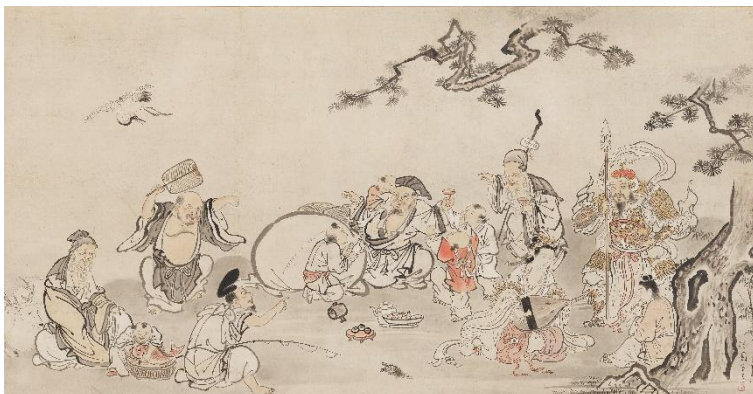
橋本雅邦《七福神遊戯図》1854年頃 福田美術館蔵