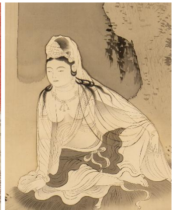
土田麦僊《観音之図》 20世紀（部分） 福田美術館蔵

飛鳥時代に伝来した仏画は、仏像と同様に、寺院や信仰の場での祈りの対象でした。近代には、明治時代初期の廃仏毀釈による大きな危機を経て、岡倉天心（1863-1913）らによる伝統美術の再評価やインドの仏跡調査が進み、仏画の制作が再び盛んになります。画家たちは西洋絵画の陰影や光の表現を取り入れながら、宗教画としての新たな可能性を追求しました。