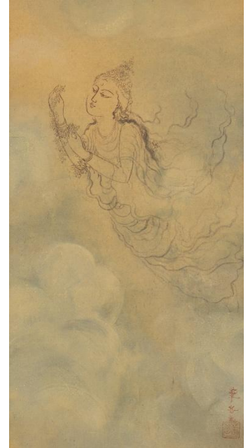
村上華岳《雲中散華》1939年 福田美術館蔵