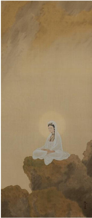
菱田春草《白衣観音》 20世紀 福田美術館蔵