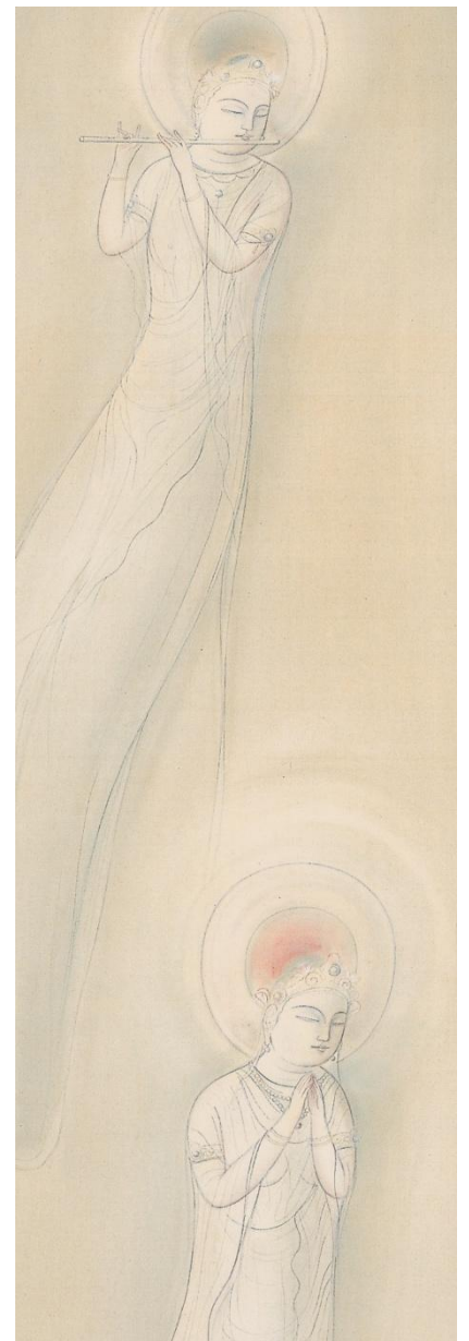
入江波光《浄天》1920年（部分） 福田美術館蔵

第1章では、29点中11点もの初公開作品が登場します。 仏画の世界に初めて触れる人も、近代の画家たちが表現した個性豊かな「ほとけさんたち」の姿に思わず魅了されてしまうのではないのでしょうか。