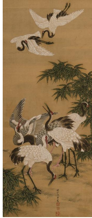
熊斐《松竹梅鶴亀図》中 18世紀 福田美術館蔵