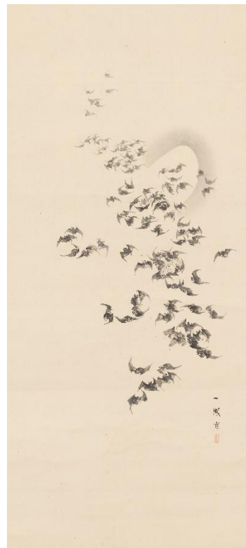
森一鳳《百蝠百鹿図》右 1870年 福田美術館蔵