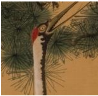
伊藤若冲《老松白鶴図》 18世紀(部分) 福田美術館蔵 通期展示