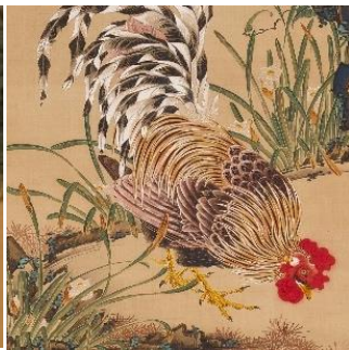
伊藤若冲《蕪に双鶏図》 18世紀 福田美術館蔵 通期展示