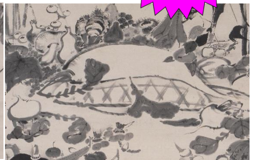
伊藤若冲《果蔬涅槃図》 1792年以前(部分) 個人蔵 5月9日～6月19日のみ展示

企画展「若冲到りハダ！野菜もウリ！」では、菜蟲譜と果蔬図巻の同時展示を目玉に、若冲最初期の作である《蕪に双鶏図》はもちろん、 初期から晩年までの若冲作品約40点が一堂に会します。