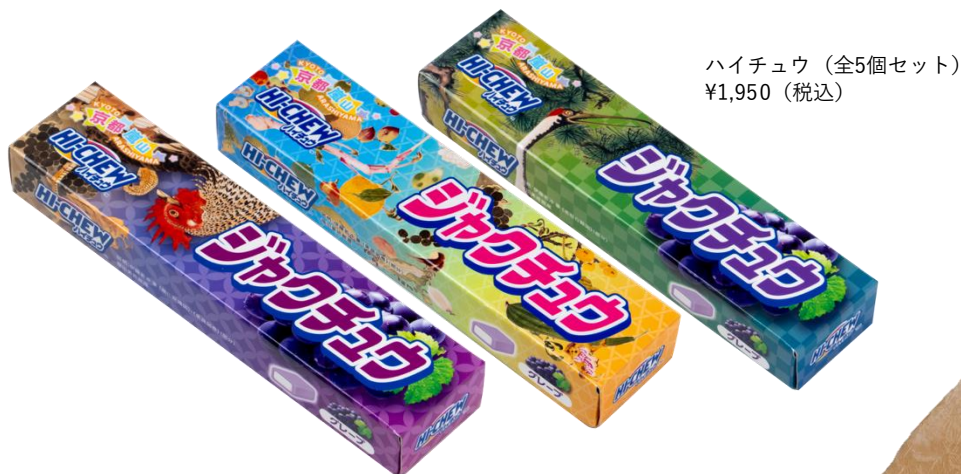
ハイチュウ（全5個セット） ¥1,950（税込）