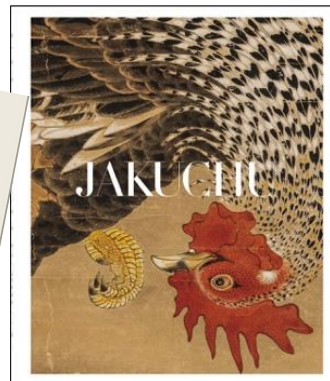
福田コレクション 伊藤若沖 図録 ¥2,800（税込）