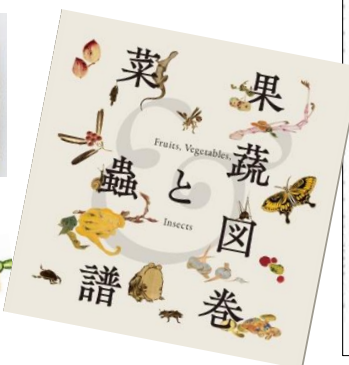
果蔬図巻と菜蟲譜 図録 ¥2,200（税込）