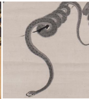
伊藤若冲《蛇図》 18世紀(部分) 個人蔵 通期展示