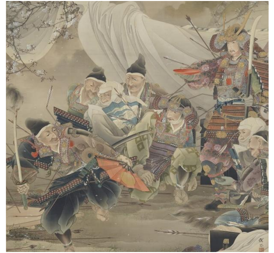
木島櫻谷《剣の舞》（部分）明治34年（1901） 公益財団法人櫻谷文庫蔵 通期展示

京都の三条室町に生まれた日本画家・木島櫻谷は、16歳から花鳥画を得意とする今尾景年に師事し、徹底した写生を礎に若くして画名を知られるようになりました。明治時代の絵の勉強といえば、手本通りに対象を描き写す「臨画」（りんが）が主流でしたが、櫻谷は漢詩にも精通していたうえ、歴史画を得意とする菊池容斎に私淑し、洋画家の浅井忠（ちゅう）とも交流して芸術への造詣を深めていました。こうした努力が実を結び、青年期から頭角を現した櫻谷は、明治40年（1907）に始まった文部省美術展覧会（文展）において動物画、歴史画、風俗画など多岐にわたる画題で6年連続の上位入賞という快挙を成し遂げます。