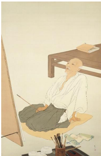
⑩木島櫻谷《画三昧》 昭和6年（1931） （公益財団法人櫻谷文庫蔵） 通期展示