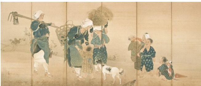
⑦木島櫻谷《和楽》（左隻）明治42年（1909） （京都市美術館蔵）