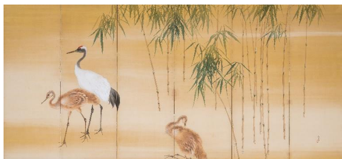
②木島櫻谷《鶴図屏風》（右隻）大正～昭和時代 （福田美術館蔵）通期展示