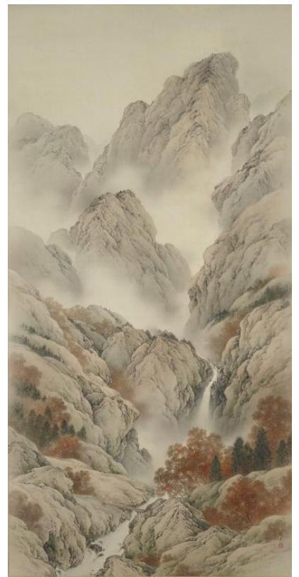
⑬木島櫻谷《峡中の秋》 昭和8年（1933） （公益財団法人櫻谷文庫蔵）通期展示