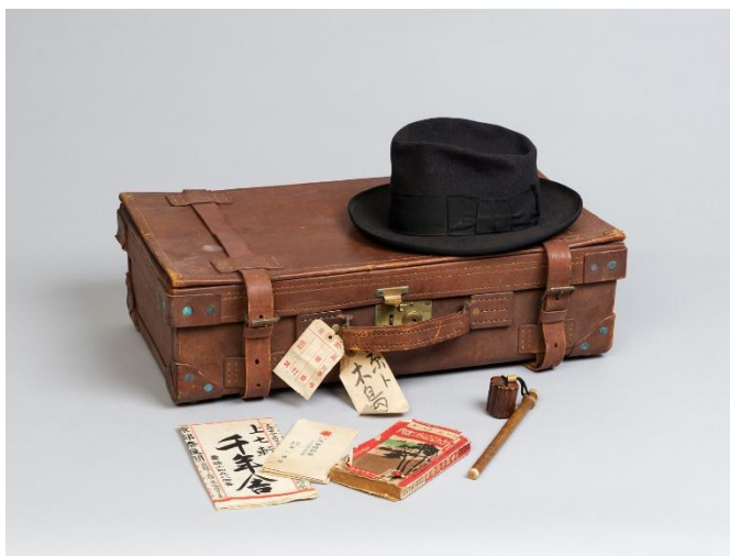
木島櫻谷所用 帽子・トランク・時刻表・矢立 （公益財団法人櫻谷文庫蔵）通期展示