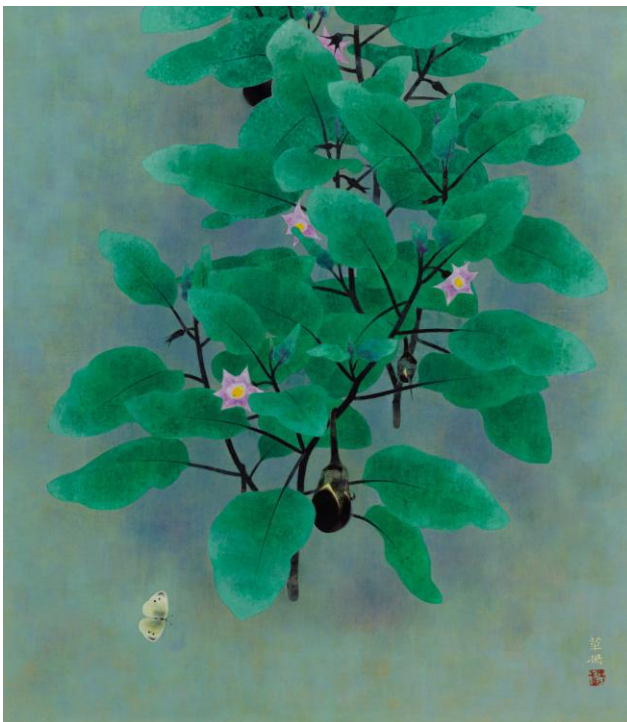
⑱山口華揚《晨》昭和44年（1969） （福田美術館蔵） 後期展示