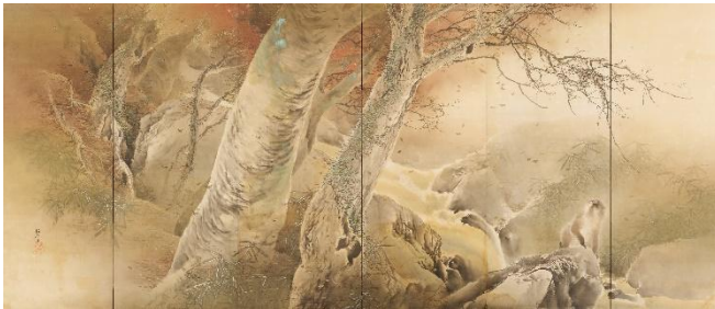
⑯木島櫻谷《細雨・落葉》（左隻）明治38年（1905） （福田美術館蔵） 前期：福田美術館/後期：嵯峨嵐山文華館展示