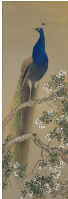
⑫木島櫻谷《孔雀》 昭和4年（1929） （公益財団法人櫻谷文庫蔵） 通期展示