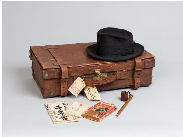
⑮木島櫻谷所用 帽子・トランク・時刻表・矢立 （公益財団法人櫻谷文庫蔵） 通期展示