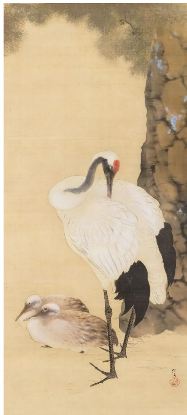
⑲木島櫻谷《松鶴図》大正時代（福田美術館蔵） 前期：福田美術館/後期：嵯峨嵐山文華館展示