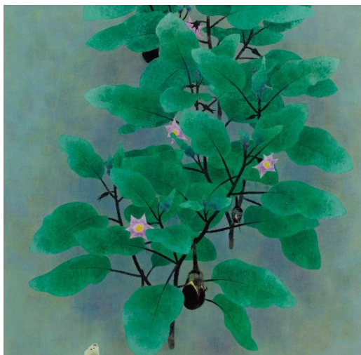
山口華楊《晨》（部分）昭和44年（1969） （福田美術館蔵）後期展示

第1章では、衣笠にアトリエを構えて絵筆をとった画家たちの作品を取り上げるとともに、同地への移住を先駆けた櫻谷の作品を展示します。また、櫻谷の息遣いを感じられる、愛用の帽子やトランクなどの遺品も公開します。