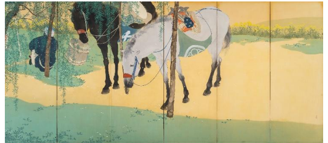
⑥木島櫻谷《駅路之春》（右隻）大正2年（1913） （福田美術館蔵）5/11～7/6展示