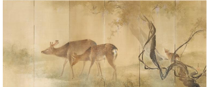
⑰木島櫻谷《細雨・落葉》（右隻）明治38年（1905） （福田美術館蔵） 前期：福田美術館/後期：嵯峨嵐山文華館展示