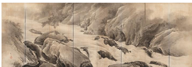
③木島櫻谷《嵐山清流》（左隻）明治41年（1908）頃 （福田美術館蔵）通期展示