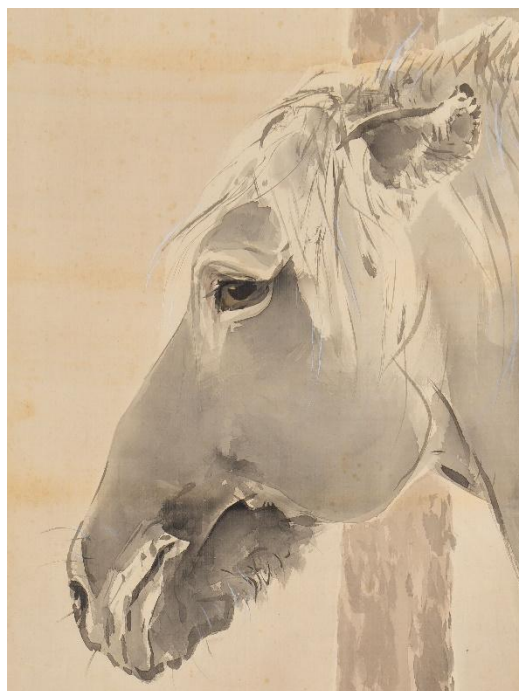
木島櫻谷《馬図》明治40年（1907）（福田美術館蔵） 前期：福田美術館/後期：嵯峨嵐山文華館展示

嵯峨嵐山文華館：通期 24 前期 15 後期 11 合計 50点 ※うち初公開：17点