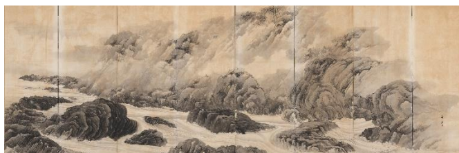
④岸竹堂《嵐山清流》（右隻）明治10年代（1877～1886） （福田美術館蔵）通期展示