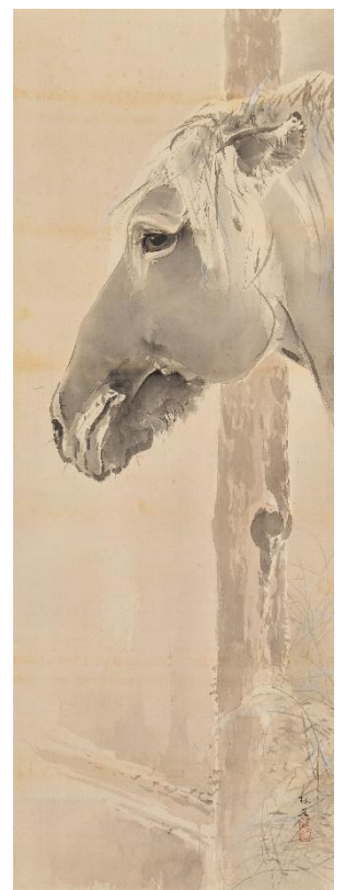
⑳木島櫻谷《馬図》 明治40年（1907） （福田美術館蔵） 前期：福田美術館/ 後期：嵯峨嵐山文華館展示