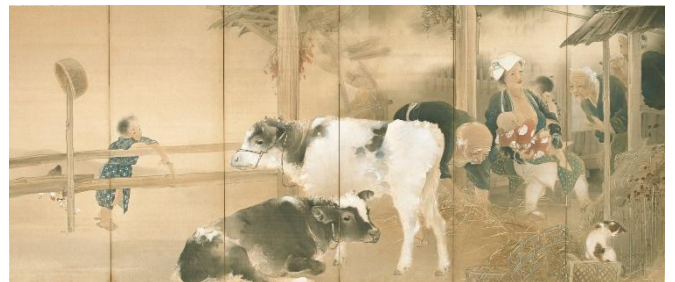
⑧木島櫻谷《和楽》（右隻）明治42年（1909） （京都市美術館蔵）