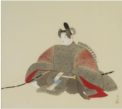
⑭菊池契月《在五中将》昭和時代 （福田美術館蔵） 通期展示