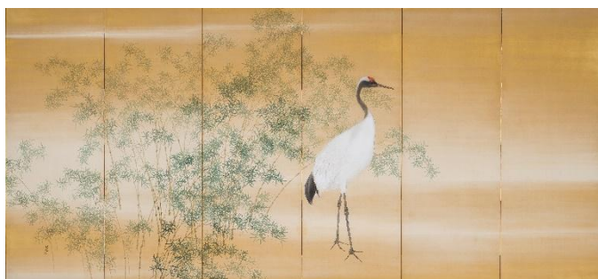
①木島櫻谷《鶴図屏風》（左隻）大正～昭和時代 （福田美術館蔵）通期展示