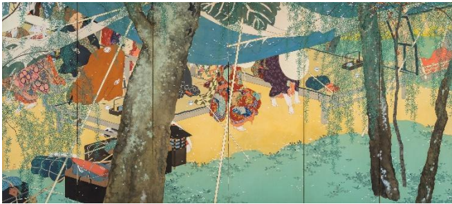
⑤木島櫻谷《駅路之春》（左隻）大正2年（1913） （福田美術館蔵）5/11～7/6展示