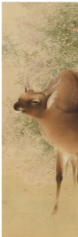
⑪木島櫻谷《秋野孤鹿》 大正14年（1925） （福田美術館蔵）通期展示