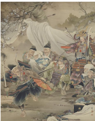
⑨木島櫻谷《剣の舞》明治34年（1901） （公益財団法人櫻谷文庫蔵）通期展示