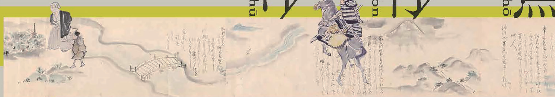
左：若冲村（いかにしの）白面（部分）/右：蕪村（十二月月風物図巻）（部分）/下：松尾芭蕉（朝顔に）白面（部分）

前期 10/22sat - 11/28mon 後期 11/30wed - 1/9mon