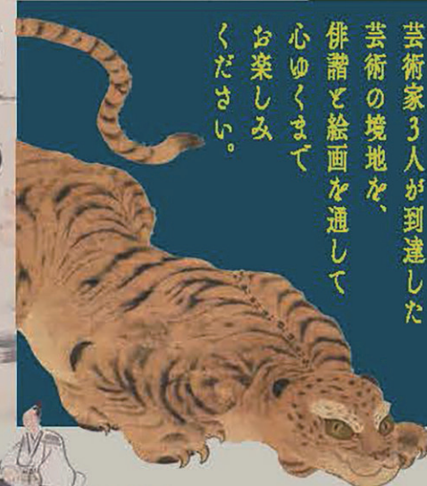
左：伊藤若冲（花林図）（部分）/中：若冲蕪村（百者葉屋図）（部分）/右：伊藤若冲（動植綵絵）（部分）

講演会 10/23 Sun 9:00~10:00 野ざらし紀行について 藤田真一氏 (関西大学名誉教授) 会場：嵯峨嵐山文華館 要予約 参加費：¥3,500 (二館共通券込)