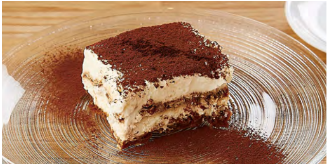
ティラミス ドリンクセット ¥ 1200 / 単品 ¥ 700