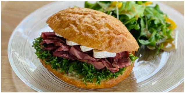
ビーフパストラミとカマンベール ドリンクセット ¥ 1300 / 単品 ¥ 850