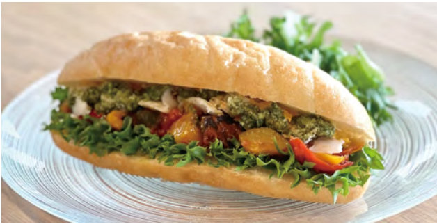
バジルチキンとラタトゥイユ ドリンクセット ¥ 1300 / 単品 ¥ 850