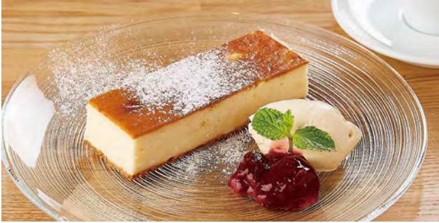
チーズケーキ ドリンクセット ¥ 1200 / 単品 ¥ 700