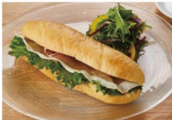
生ハムとモッツアレラセット (ドリンク付き) ¥1200