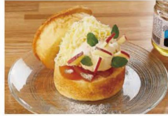
季節のハニーtoastセット (ドリンク付き) ¥1350