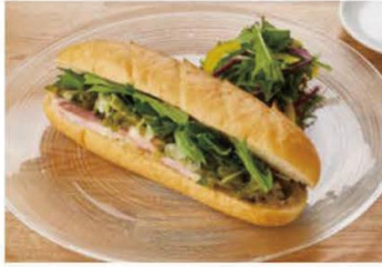
豚バラコンフィと九条ネギセット (ドリンク付き) ¥1200