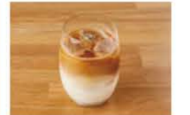
アイスカフェラテ ¥500