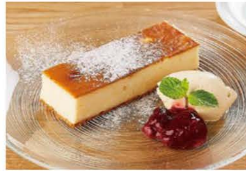
チーズケーキセット (ドリンク付き) ¥1000