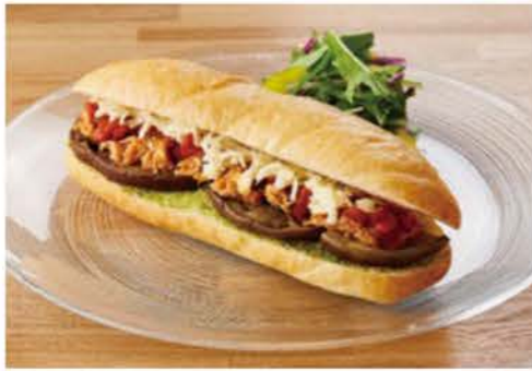
賀茂茄子とツナラタトゥイユセット (ドリンク付き) ¥1200