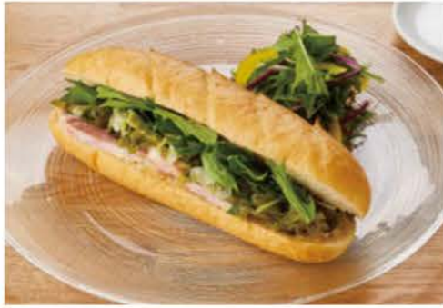
豚バラコンフィと九条ネギセット (ドリンク付き) ¥1200