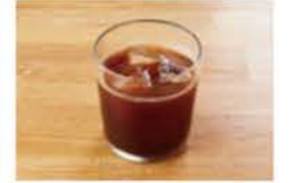
アイスカフェアメリカーノ ¥450