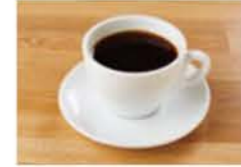
カフェアメリカーノ ¥450