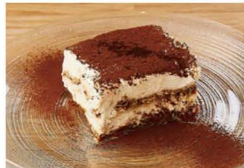
ティラミスセット (ドリンク付き) ¥1000