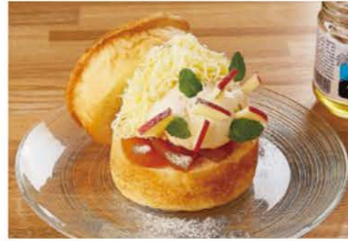
季節のハニートーストセット (ドリンク付き) ¥1350