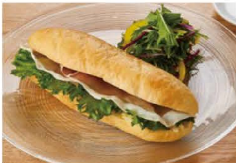
生ハムとモッツアレラセット (ドリンク付き) ¥1200